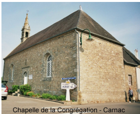
Chapelle de la Congrégation - Carnac