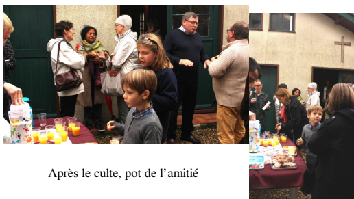
Après le culte, pot de l'amitié

Si vous souhaitez participer à ces soirées passionnantes, rendez-vous le jeudi 26 novembre , de 18h30 à 20h30, au presbytère. Cette fois-ci, nous dialoguerons autour de deux autres affiches : « Le goût de la lecture » et « Enseigner ou soigner ? Oser rêver d'un métier ».